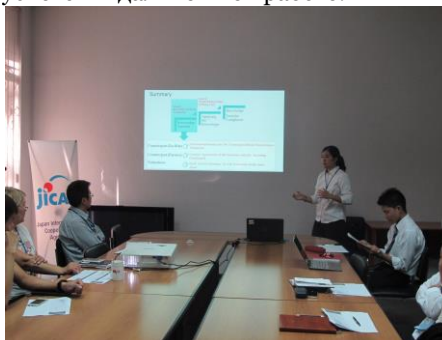
Презентация итогового отчета

предложениями по улучшению работы добровольцев. Их исследования внесли большой вклад в волонтерскую деятельность JICA в КР. Мы желаем им успехов в дальнейшей работе! ●