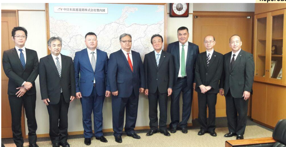
Встреча делегации из КР с представителями NEXCO Central в Японии