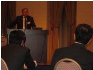
В ходе форума

20 октября в Саппоро был проведен форум по сотрудничеству между Японией и странами Центральной Азии в сфере транспортной инфраструктуры и логистики. Целью данного мероприятия является обмен опытом по технологиям строительства дорог и предупреждения