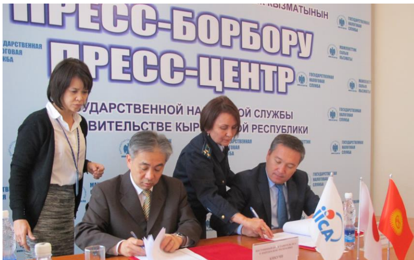
Церемония подписания протокола переговоров

26 октября 2016 года состоялось подписание Протокола переговоров между JICA и Государственной налоговой службой при Правительстве Кыргызской Республики относительно нового проекта технического сотрудничества "По улучшению системы развития кадрового потенциала Государственной налоговой службы КР". ●