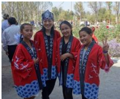
Волонтер JOCV со своими ученицами