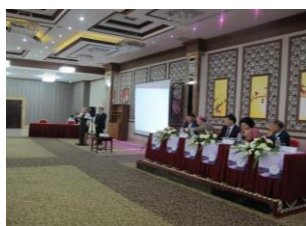
Выступление постоянного представителя JICA

22 сентября 2016 года состоялось мероприятие посвященное 55-летию Национального центра охраны материнства и детства. В рамках мероприятия приняли участие специалисты стран ближнего и дальнего зарубежья. В ходе мероприятия выступил Постоянный представитель JICA в КР, он отметил долголетнюю историю дружбы JICA и Национального Центра охраны материнства и детства, также рассказал, что на данный момент в центре