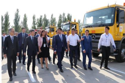
Осмотр аэродромной техники