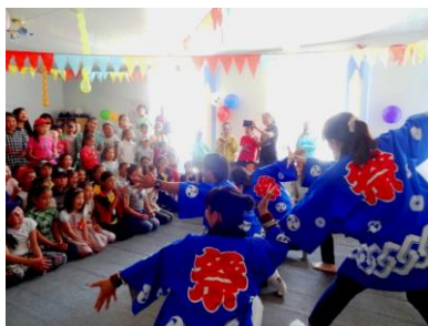
«Танец рыбака»-«Сооран буци»

Фестивали японской культуры уже хорошо знакомы и любимы детьми Кыргызстана. Они с нетерпением ждут их, чтобы окунуться в культуру страны Восходящего солнца. В этот раз, фестиваль прошел при поддержке волонтеров JICA в одной из школ Ак-Суйского района Иссык-Кульской