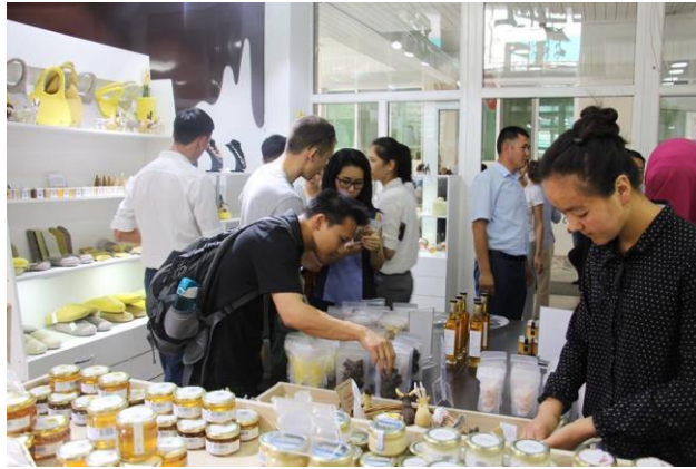
Магазин "Nomad Store" в г. Ош по адресу: ул. Байлинова, 1 (в отеле "Ош Нуру")

В Оше открылся первый региональный магазин "Одно село – один продукт" (ОСОП) "Nomad Store". Церемония открытия состоялась 3 июля 2018 г. в городе Оше, в которой приняли участие представители местных органов власти, члены комитета ОСОП Ошской области, представители международных организаций, производители и другие гости. Посетителям были представлены продукты, производимые в рамках проекта