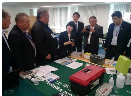
Визит в компанию Fujiita по производству мини-оборудования в животноводстве.

Тренинг «Улучшение технологий и системы ветеринарии и животноводства для производства и дистрибуции сырого молока», организованный проектом JICA по рыночно-ориентированному производству сырого молока в Чуйской области (МОМР), прошел в Японии. В тренинге приняли участие 11 представителей молочного сектора из Кыргызстана. В рамках тренинга участники ознакомились с японским опытом развития и управления молочным сектором, а также узнали как содер-