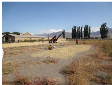
Кочкорка. Место, где планируется построить ТЛЦ локального типа