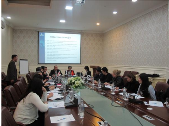
Во время семинара

18 ноября 2016 года в г. Бишкек были организованы два семинара в рамках визита миссии из Головного управления JICA, Отдела промышленного развития и государственной политики. Один семинар был для сотрудников Министерства экономики КР где основными темами являлись “История политики в отношении малых и средних предприятий Японии”,