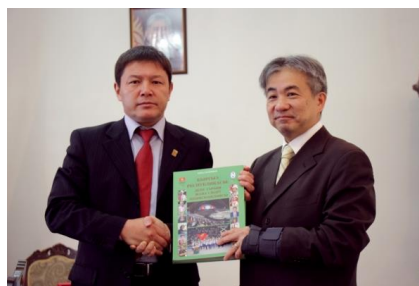
Во время встречи

курса и готово расширить сотрудничество в этом направлении. Надеемся, что будущие проекты – в основном связанные с направлением волонтеров в сфере спорта, будут способствовать популяризации спорта в Кыргызской Республике. ●