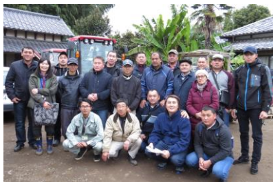
Во время стажировки

14 фермеров из Кыргызстана с 15 ноября по 3 декабря 2016 года прошли обучение в Японии и Тайланде по производству и экспорту семян овощных культур. Тренинг был организован в рамках деятельности Проекта по продвижению производства экспортоориентированных семян овощных культур в КР с целью развития потенциала в этой сфере для последующего экспорта семян на основе договоренностей с зарубежными семенными компаниями. Фермеры с весны года принимают участие в Тренинге для - для тренеров